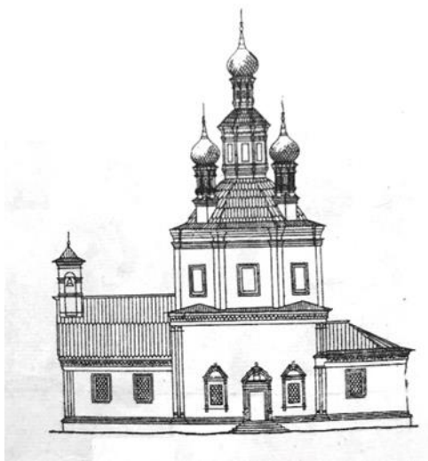
Рис. 1. Реконструкция северного портала Троицкого собора, предложенная Н. Н. Свершниковым.

Ранее при работе над реконструкцией вида Троицкого собора после перестройки 1696 года было выдвинуто предположение, что изначальное завершение имело пирамидальную форму [5]. Эта версия отличается от предложенной Н. Н. Свершниковым реконструкции собора, которая была составлена при обследовании собора. Согласно его работе, храм изначально завершался пятиглавием (Рис. 1).