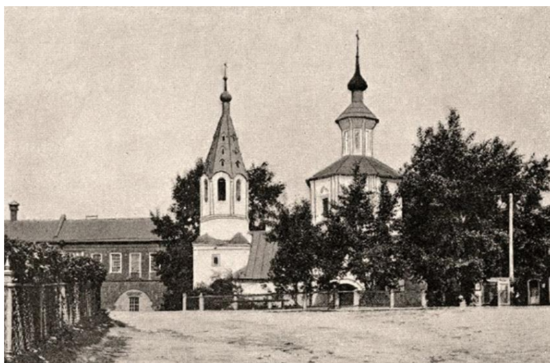
Рис. 5 Фотография церкви Вознесения [1].

по силуэту напоминает Троицкий собор. Не сохранивший храм крайне интересен для исследования. В отличие от других серпуховских храмов он почти не подвергался перестройкам. Здесь сохранились изначальная трапезная, шатровая колокольня, пирамидальное завершение основного объема храма. На барабан поставлен миниатюрный купол, что делает церковь устремленной вверх. Всё также бросается в глаза принципиальная скупость декоративных элементов. Лопатки на гранях объема храма и декоративный карниз роднят эту небольшую церковь с оформлением Троицкого собора.