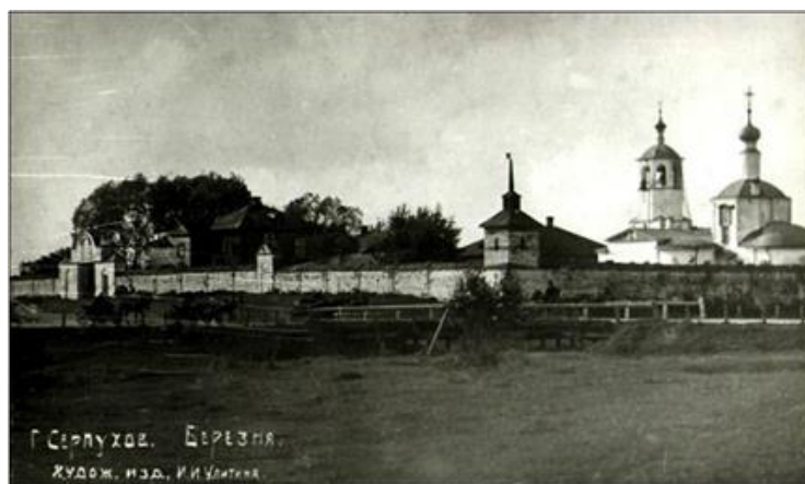
Рис. 3 фотография церкви Николая в погосте Березня между 1918 и 1930 годом, фото И. И. Улитина из личного собрания Ю. Соломатина.

Необходимо обратить внимание на пирамидальное завершение храма и отсутствии пятиглавия на восьмерике. Это может говорить о том, что прообразом в возведении данного храма как раз и стал Троицкий собор. Конечно же как можно видеть даже на этой фотографии архитектура церкви не такая изящная как у Троицкого собора, но и нужно понимать, что Троицкий собор на тот момент – это главный храм города, а церковь на небольшом погосте играет второстепенную роль. Отсюда и скупость в архитектурном оформлении, но зато прослеживается четкость силуэта и стремление к высоте храма.