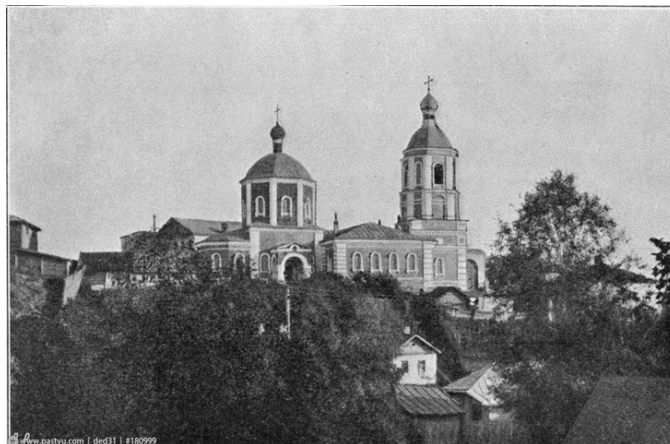
Рис. 6. Фотография церкви Преображения [1].

апсиды, чтобы увязать архитектуру новых элементов со старыми частями храма. Об изначальном завершении храма после его перестройки говорить сложно.