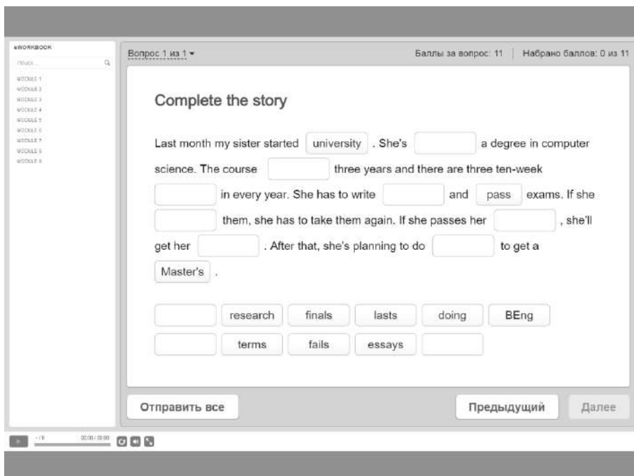
Рис. 1. Условно-речевое упражнение

просмотрового чтения студенты учатся понимать связь введенного лексического материала с другими словами и словосочетаниями в контексте (Рис. 2).