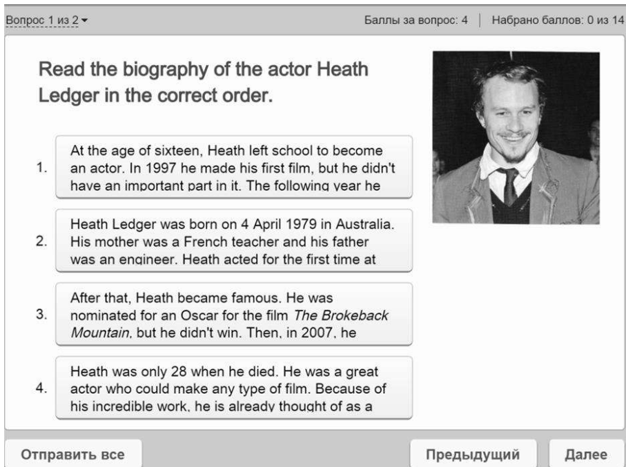
Рис. 2. Работа с текстом

Усвоение лексики невозможно без восприятия иноязычной речи на слух, т.е. аудирования. Студенты, внимательно вслушиваясь в звучащую речь, формируют умение понимать смысловое содержание высказывания на иностранном языке. Через аудирование идет восприятие, узнавание и понимание слова в контексте. Безусловно, успешность понимания речи на слух зависит от языкового опыта учащихся, а также от наличия как активного, так и пассивного словарного запаса. Поэтому в разделе «Listening» каждый студент может найти себе аудирование по силе. Мы подобрали задания на аудирование с пониманием