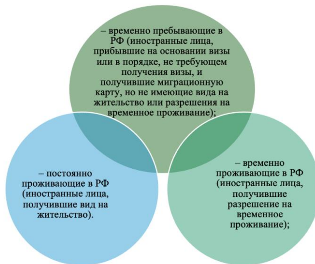
Рис. 2. Иностранцы по основаниям нахождения на территории РФ

Согласно Конституции РФ, иностранные граждане и лица без гражданства обладают правами, и несут те же обязанности, что и граждане РФ, кроме случаев, установленных законодательством или же международным договором РФ [2].