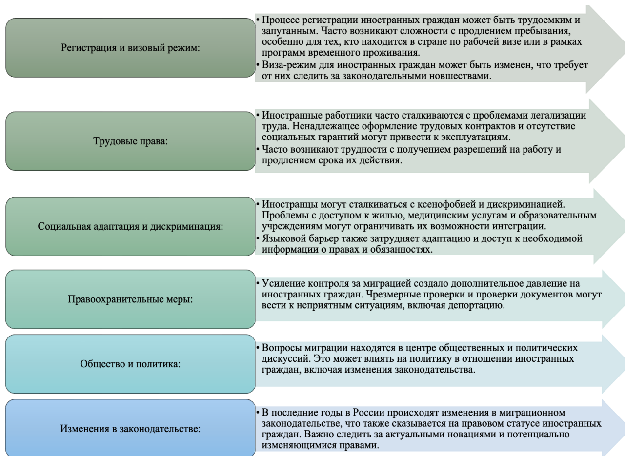
Рис. 4. Проблемы правового статуса иностранных граждан в России

Как известно, в нашей стране проводятся постоянные проверки данных иностранных граждан на предмет соблюдения законодательства Российской Федерации. Так, согласно данным Министерства внутренних дел Российской Федерации, с начала 2024 г. увеличилось число выявленных нарушений в области миграционного законодательства на 12,8%. Количество составленных административных протоколов возросло на 44,6%, выдворено из страны (депортированы) на 53,2% больше, чем за такой же период 2023 г. Также 143 тыс. иностранным гражданам запрещен въезд в нашу страну [11]. Статистика показывает, что усиление миграционных проверок и изменения в законодательстве позволило достичь положительной динамики по выявлению нарушений миграционного законодательства, расследованию и предотвращению преступных деяний.