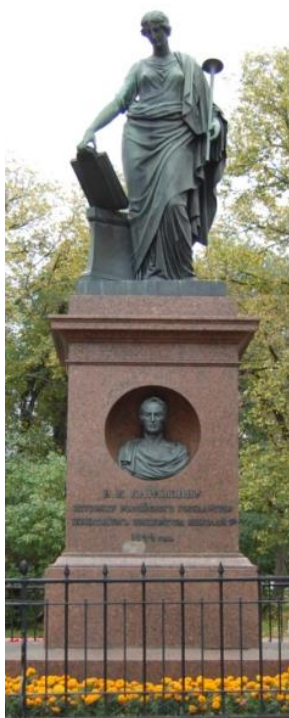
Рис. 2. Памятник Н.М. Карамзину в Симбирске.