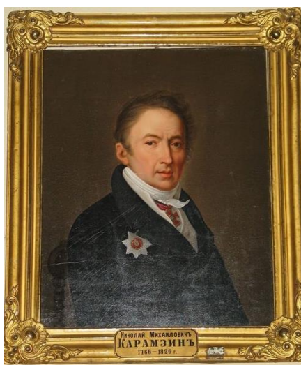
Рис. 7. Портрет Н.М. Карамзина, подаренный В.Н. Карамзиным.

Хотя относительно автора этого полотна до сих пор не утихают споры специалистов, портрет и сейчас является украшением библиотеки.