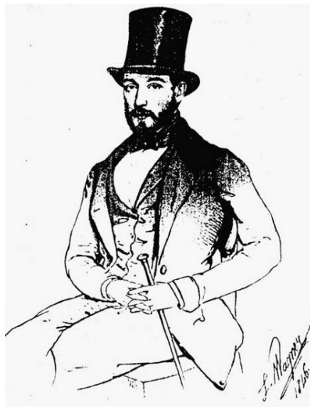
Рис. 6. Владимир Николаевич Карамзин.

пию с работы известный петербургский художника Александра Григорьевича Варнека (рис. 7).