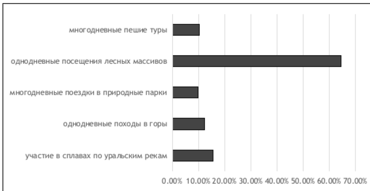
Рис. 1. Участие студентов колледжа в маршрутах экологического туризма (по результатам опроса).

Что касается экологических проблем, возникающих в природных и национальных парках в связи с интенсификацией туристического потока, то согласно данным проведенного опроса, самыми серьезными являются беспокойство животных, бесконтрольный сбор цветущих растений, в том числе, занесенных в региональную и федеральную Красные книги и оставление ту-