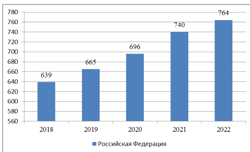
Рис. 2. Обеспеченность детей дошкольного возраста местами в организациях на 1000 детей, ед.

При этом, следует отметить, что, с одной стороны, наблюдается повышение мест на 1000 детей, с другой – увеличение обеспеченности на фоне снижения численности рождения детей и сохранения количества мест в детских дошкольных учреждениях.