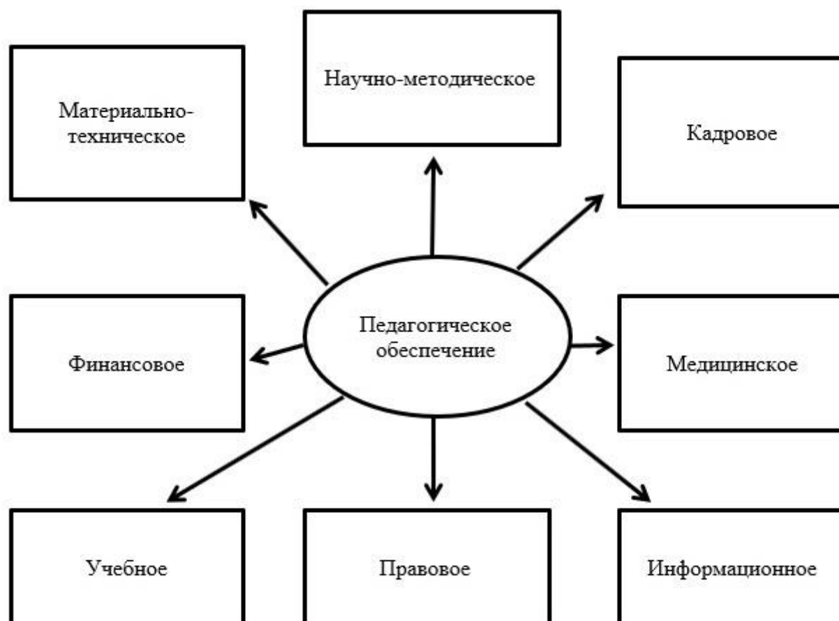
Рис. 2. Наиболее ключевые блоки видов педагогического обеспечения качества услуг в туристско-рекреационной сфере.

методический кластер (точнее, именно методический — он является основой детерминации качества реализации мероприятий, получения требуемой оптимальной нагрузки человеком, создает эмоциональный благоприятный фон похода, мотивирует личности) и медицинский вид обеспечения.