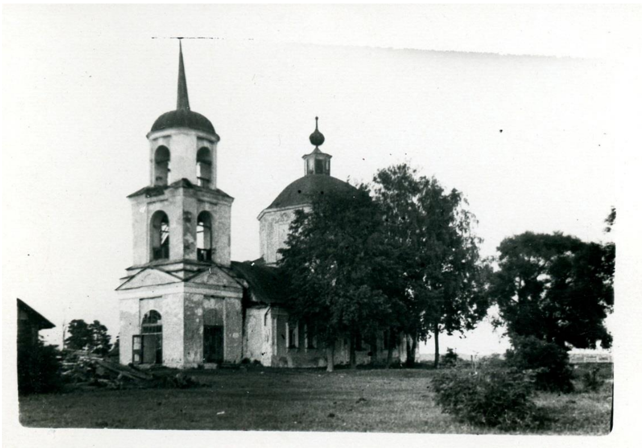
Рис.3 Общий вид южного фасада храма с колокольней.