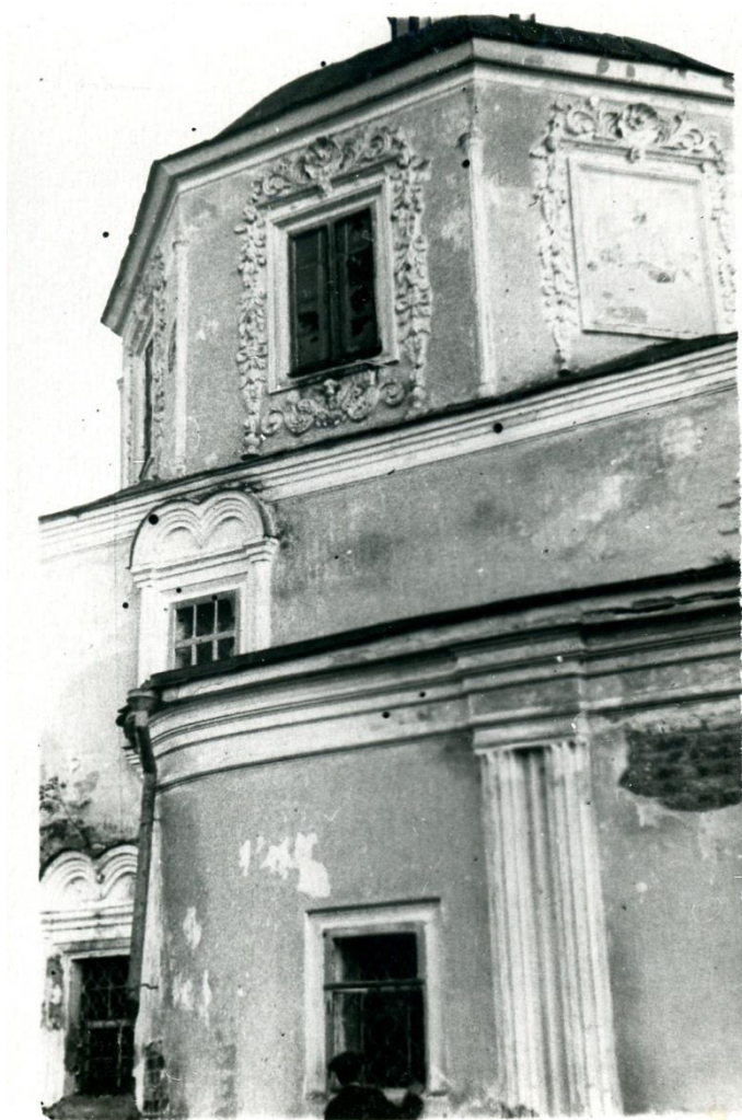
Рис.5 Центральная часть храма с частью северного придела.