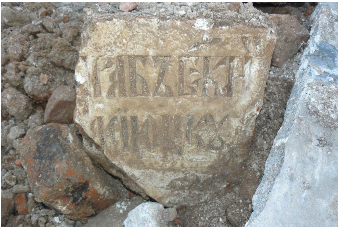
Рис. 6. Фрагмент камня со славянской вязью на церковном месте, 2021 г.

Во время обследования развалин храма автором в июне 2021 года был обнаружен фрагмент подобного камня со славянской вязью (Рис. 6).