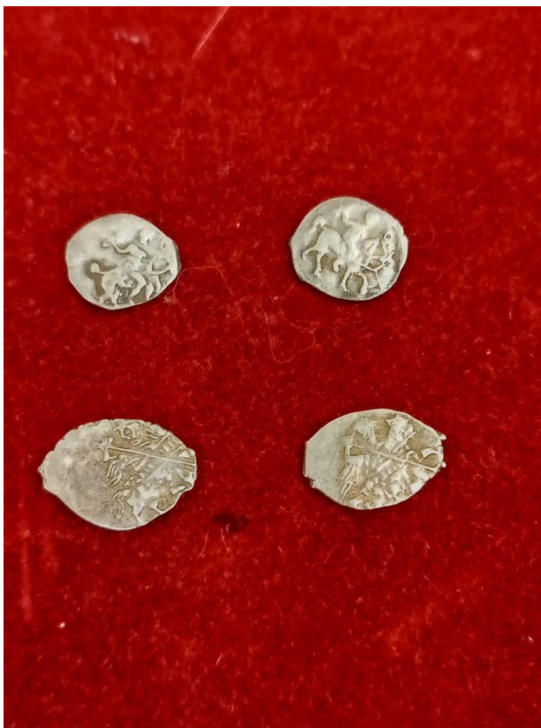
Рис. 7. Монеты, найденные на церковном месте.

На церковном месте жителем села Бунырево С.В. Гориным в 2011 году были сделаны находки монет (рис.7).