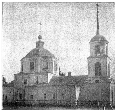
Рис. 22. Церковь с. Бунырева, Алексинского у., Тульской губ.

Рис. 1. Храм в с. Бунырево Алексинского уезда.