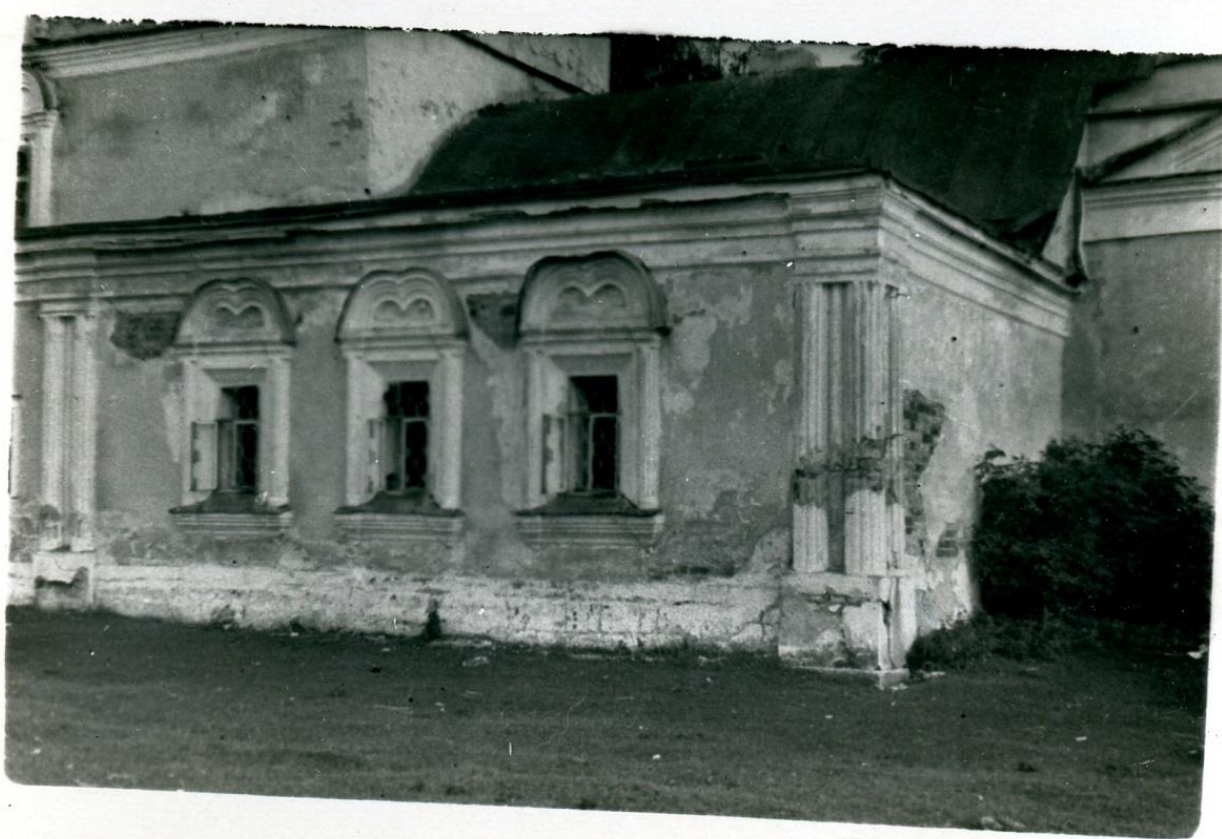
Рис.4 Придел во имя Благовещения пресвятой Богородицы.