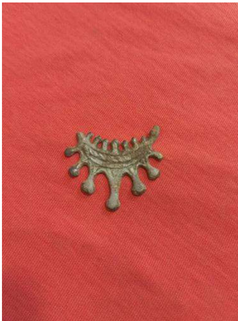
Рис. 5. Фрагмент семилопастного височного женского украшения.

Установлено, что украшение было сделано из сплава бронзы с оловом.