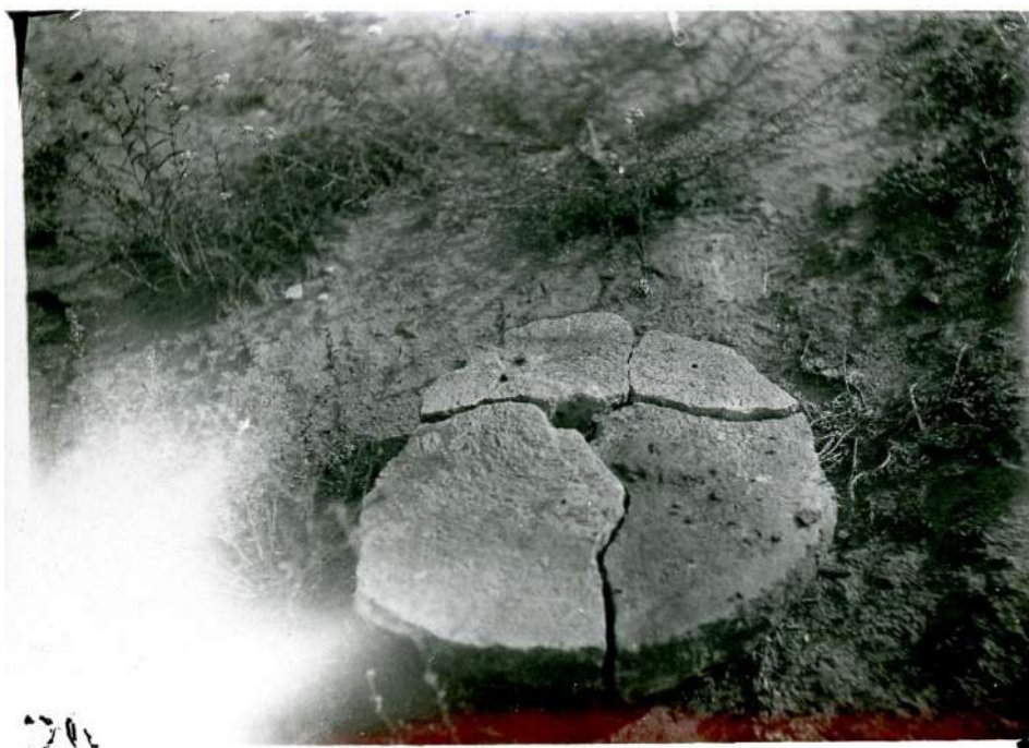
Рис.1. Расколотый жернов (находка на месте городища при селе Бунырево) Август 1938 г.

Действительно, с 1929 года начал свою работу каменный карьер при селе Бунырево, что дало толчок к утрате городища. Буныревский карьер входил в алексинскую артель «Нерудоснаб» – промышленное предприятие по добыче нерудных ископаемых: песка, бутового камня и гравия [10, с. 136]. Предварительная разведка показала, что мыс, на котором находится городище, изобилует гравием и щебнем с песком. Работы в карьере начались у восточного берега реки Оки и велись в направлении городища с целью расчистки холма и выхода к ручью Гремячему.