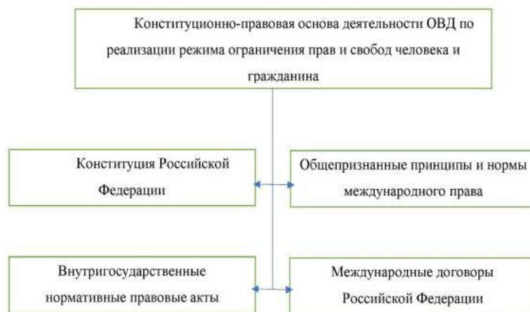
Рис. 1. Источники правовой регламентации ограничения права на неприкосновенность жилища.

Права и свободы человека, их реализация и, следовательно, ограничение, относятся к ведению федерального законодателя. Следовательно, по данному вопросу осуществляется единое федеральное регулирование.