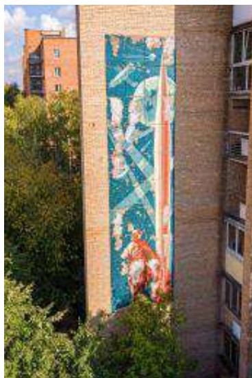
Рис.9. Мозаичное панно с изображением Циолковского на жилом здании в г. Королёве, керамическая плитка, современное состояние.