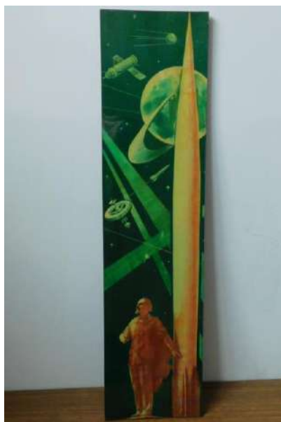
Рис. 10. Вариант эскиза (?) Л.М. Кадушина к мозаике с изображением Циолковского. Фото М. Мироновой, 2020 г.

Петровичу Абрамову на юбилей (Рис. 11). Он тех же пропорций, что и выполненная монументальная работа. Эта находка даёт перспективный материал для дальнейшего изучения творческого наследия Л.М. Кадушина.