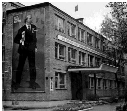
Рис. 7. Здание Калининградского горкома КПСС (ныне здание Королёвского городского суда) с плакатом «Есть такая партия!», 1970-е.

За это время он выполнил немало масштабных работ, включая крупный плакат с изображением В.И. Ленина на здании калининградского горкома (Рис. 7).