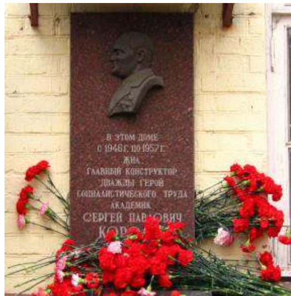
Рис. 12. Мемориальная доска на доме, где жил С.П. Королёв, 2005 г.