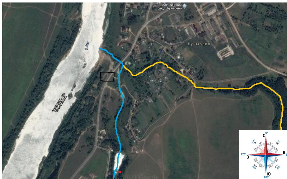
Рис. 3. Расположение городища на спутниковой фотографии села Бунырево. Источник: Google-карты ( https://www.google.ru/maps ). Коллаж автора.

На Рис. 3 – спутниковая фотография села Бунырево наших дней, на которой голубым цветом помечено бывшее русло