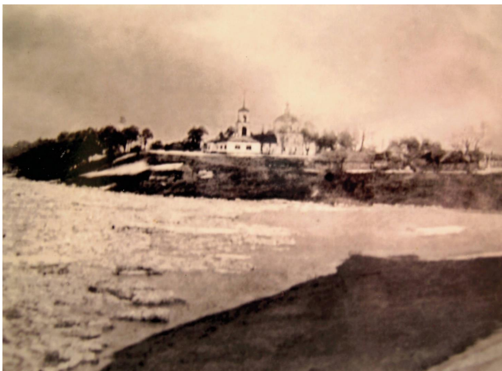
Рис. 1. Вид на храм в селе Бунырево, 1915–1916 гг.

Описанный Н.И. Троицким холм частично показан на фотографии (Рис. 1), сделанной в 1915–1916 гг. Именно на нем располагалась точка съемки, с которой фотографировали вышеупомянутый храм.