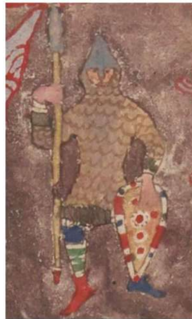
Рис. 2. MS Lat. 6401, фрагмент, начало XI века. Национальная библиотека Франции

Эти самые ранние примеры хорошо коррелируют с последующими изображениями миндалевидных щитов во французских источниках XI века, очень разнообразными и качественными. Есть заметное сходство с изображениями с ковра из Байе и рядом других миниатюр XI - начала XII ве-