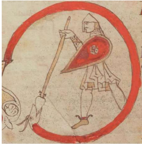
Рис. 1. Latin 46, фрагмент, около 1000 гг. Национальная библиотека Франции

шого размера. Стоит отметить, что здесь пропорции людей и предметов сильно искажены, а цветовое оформление миниатюры крайне пестрое (рис. 2).