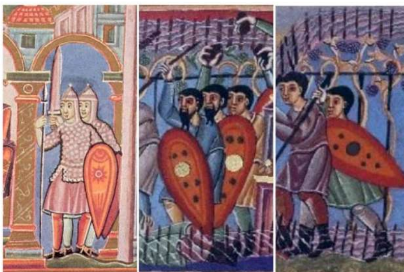
Рис. 5. Codex aureus Epternacensis, фрагменты, 1030-1050 гг. Германский национальный музей