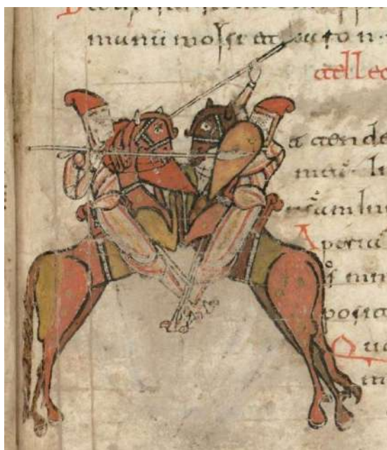
Рис. 4. Манускрипт из Сан-Мильян-де-ла-Коголья, фрагмент, X-XI вв. Королевская академия истории, Испания

ров мастерства художников эпохи Оттонов [4]. Деятельность Эхтернахского скриптория пережила взлет при аббате Хумберте, который руководил монастырем в 1028 – 1051 годах. В этот период в стенах аббатства было создано несколько выдающихся иллюстрированных рукописей, предназначенных для императора Генриха III. «Золотой Кодекс» содержит полноцветные миниатюры с миндалевидными щитами в руках воинов и «злых виноградарей». Щиты большие и выписаны довольно детально (рис. 5).