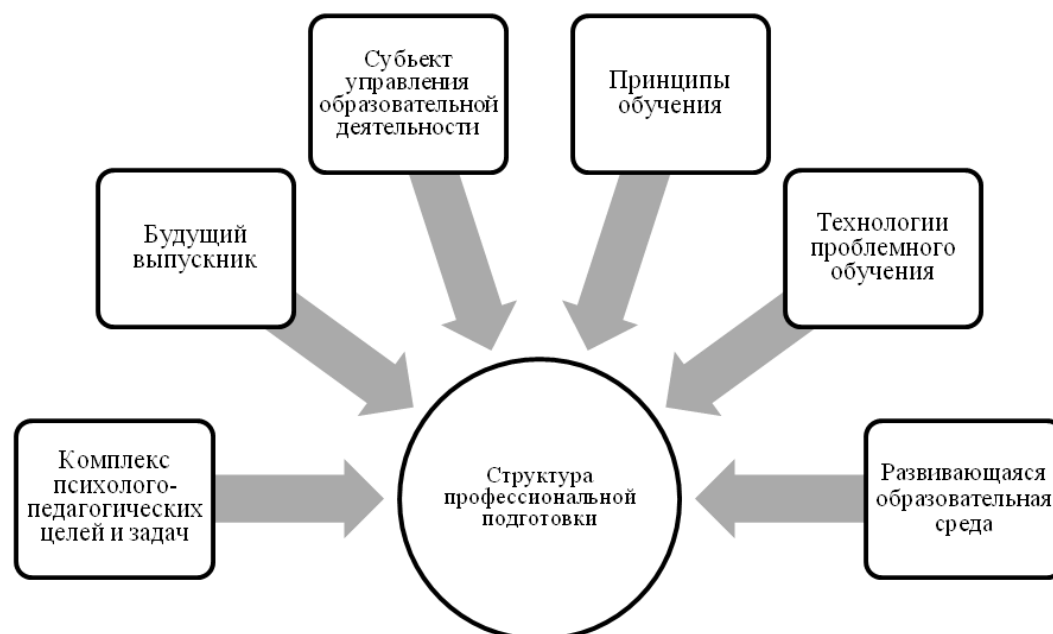
Рис. 2. Структура профессиональной подготовки будущих офицеров

Так, например, В.А. Юматов в своем исследовании утверждает, что профессиональная подготовка будущих офицеров подразделений специального назначения ВВ МВД РФ в содержательном плане включает в себя гуманитарное, боевое и специальное обучение, воспитание, физическое и психологическое развитие личности курсанта (Рис. 2) [20].