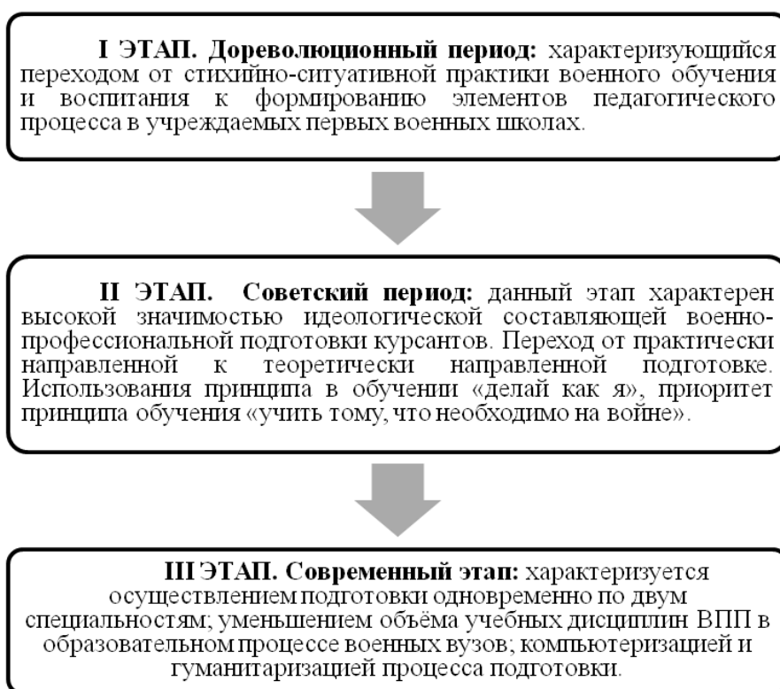
Рис. 1. Историко-педагогический анализ организации военной подготовки в вузах

Важность историко-педагогического анализа организации военной подготовки в вузах подтверждено многими исследо- ваниями. Например, работа И.В. Симо- ненко, который выделил три этапа разви- тия военно-профессиональной подготов- ки офицерских кадров в военно-учебных заведениях (Рис. 1.) [17].