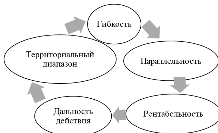
Рисунок 1. Отличительные черты дистанционного обучения

Среди главных отличительных черт дистанционного обучения, которые раскрывают его потенциал, можно выделить следующие (Рис. 1).