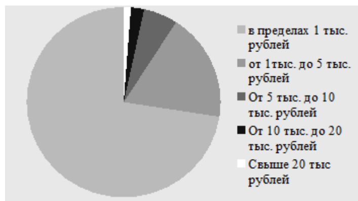
Рисунок 2. Суммы, перечисленные студентами колледжа УрГЭУ финансовым мошенникам

Как показывают приведенные выше данные, большая часть обучающихся перечисляла мошенникам относительно небольшие суммы (в пределах 1-5 тысяч рублей), однако, если принять во внимание средний возраст опрашиваемых – 16,4 года, то общее количество лиц вовлеченных в разнообразные мошеннические схемы в качестве жертв, заставляет серьезно задуматься об уровне финансовой грамотности последних и явно недостаточно сформированной у них финансовой компетентности на уровне потребителей. Вопреки широко распространенному в российском социуме мнению, согласно которому чаще всего жертвами финансовых мошенников становятся лица пожилого возраста, чье гражданское становление происходило в совершенно других социально-экономических условиях, и кто относительно плохо разбирается в передовых технологиях информационного общества, как показывают наши выборочные исследования, студенческая и школьная молодежь также находится в «зоне риска», поскольку в силу недостатка личного опыта и некоторых психологических особенностей поведения (слишком доверчивое отношение к информации, если она исходит от людей более старших возрастных групп) склонна недооценивать опасность, исходящую от посторонних граждан. Вследствие этого, значительная часть несовершеннолетних лиц не только сталкивается с различными видами финансового мошенниче-