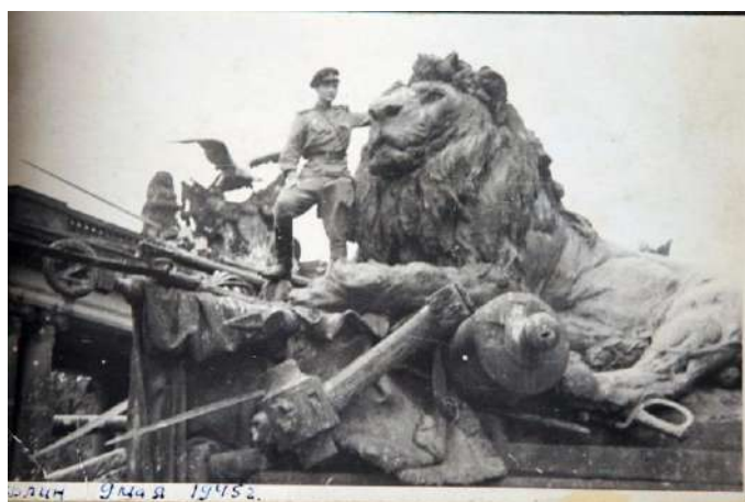
Э.В. Ильенков, Берлин 9 мая 1945 года [8]

Стоит отметить, что Э.В. Ильенков достойно, мужественно и с честью прошел войну в действующей армии с 1943 года до 9 мая 1945 года, дойдя до Берлина.