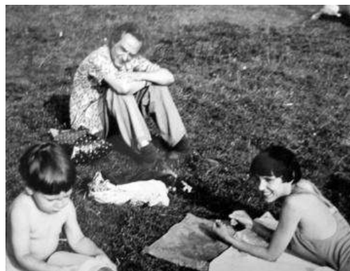
Э.В. Ильенков дочерью и внуком Ваней (лето 1976 года) [8]